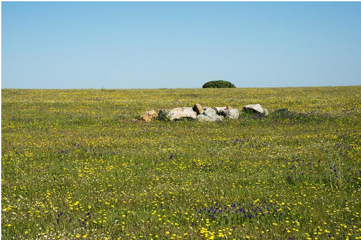
Stäppen i full blom

Kulturupplevelserna är fantastiska! Vi kommer att besöka gamla staden i Trujillo med den vackra borgen och där stadens söner var en del i "upptäckten" av Sydamerika!