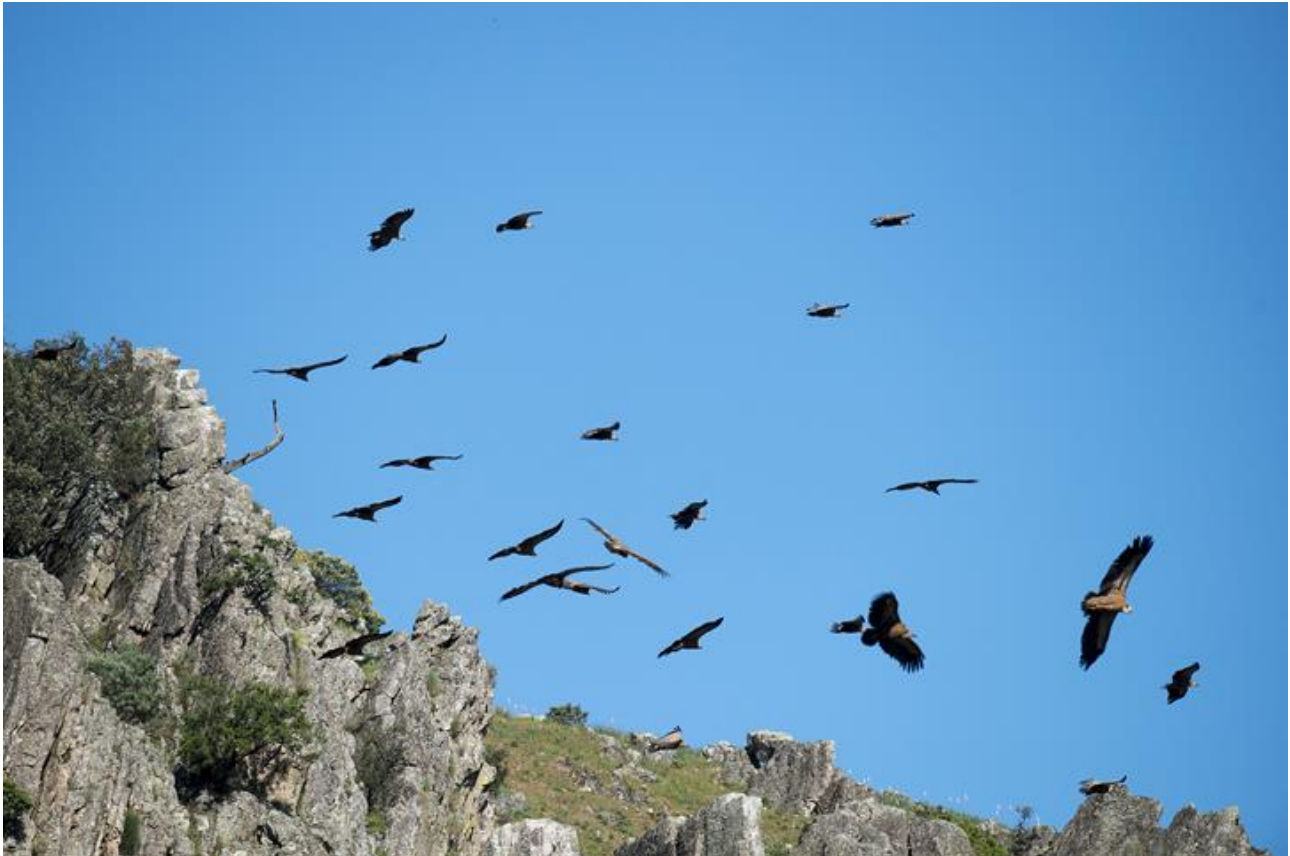
Gåsgamar i Monfragüe N.P.

Här på klippan finns den mer sällsynta svarta storken och den häckar här sida vid sida med gåsgamarna. Från Peña Falcón är vårt nästa stopp längs floden Tejo, vilken är huvudfloden genom parken. Vi kommer att ta en promenad längs floden eller längs något av biflödena. Förutom många intressanta växter och blommor, är det uppe i luften som det händer. Rovfåglar ses överallt och längs floden finns det goda chanser för hökörn, dvärgörn och ormörn.