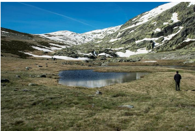
Sierra de Gredos

Vi gör en kortare morgontur i närheten av hotellet för att leta efter citronsiska och bergsångare. Vi lämnar hotellet på förmiddagen för att ta eftermiddagsflyget till Köpenhamn, där vi landar ca. 19.00.