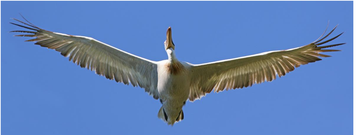
The Big One!

Nästa stopp var Vadu , där ett antal grunda saltvattendammar skapar ett Eldorado för våtmarksfåglar. Här såg vi flera arter vadare; stytlöpare, skärfläckor, rödbenor, småsnäppor, spovsnäppor, mosnäppa, grönbena, dammsnäppa alla tre arter strandpipare mm. I vassarna hade vi ytterligare några fältsångare samt säv-, rör-, vass- och trastsångare samt skäggmes och en rördrom som endast lät sig höras. En fin koloni med drygt 30 par rödvingade vadarsvalor häckade här men ingen svartvingad hittades (ses här då och då). Dvärgmåsar och fisktärnor var vanliga och sågs i stora flockar. En krushuvad pelikan drog över huvudet på oss på låg höjd och nu insåg man hur stor denna pjäs är (Europas största vingspann med imponerande 320 cm!). Vi avslutade vår tur i Vadu med en stund vid Svarta havskusten, där några av oss badade medan övriga passade på att njuta längs stranden. Nya arter här blev fyra rastande storlommar och en medelhavstrut. På vägen hem stannade vi längs vägen mellan Vadu och Corbo , där vi snabbt hittade fyra kalenderlärkor, ny art för resan. På hotellet blev det middag och artgenomgång och det var dags att packa ihop våra resväskor för nästa morgon skulle vi ut på vår flodtur.