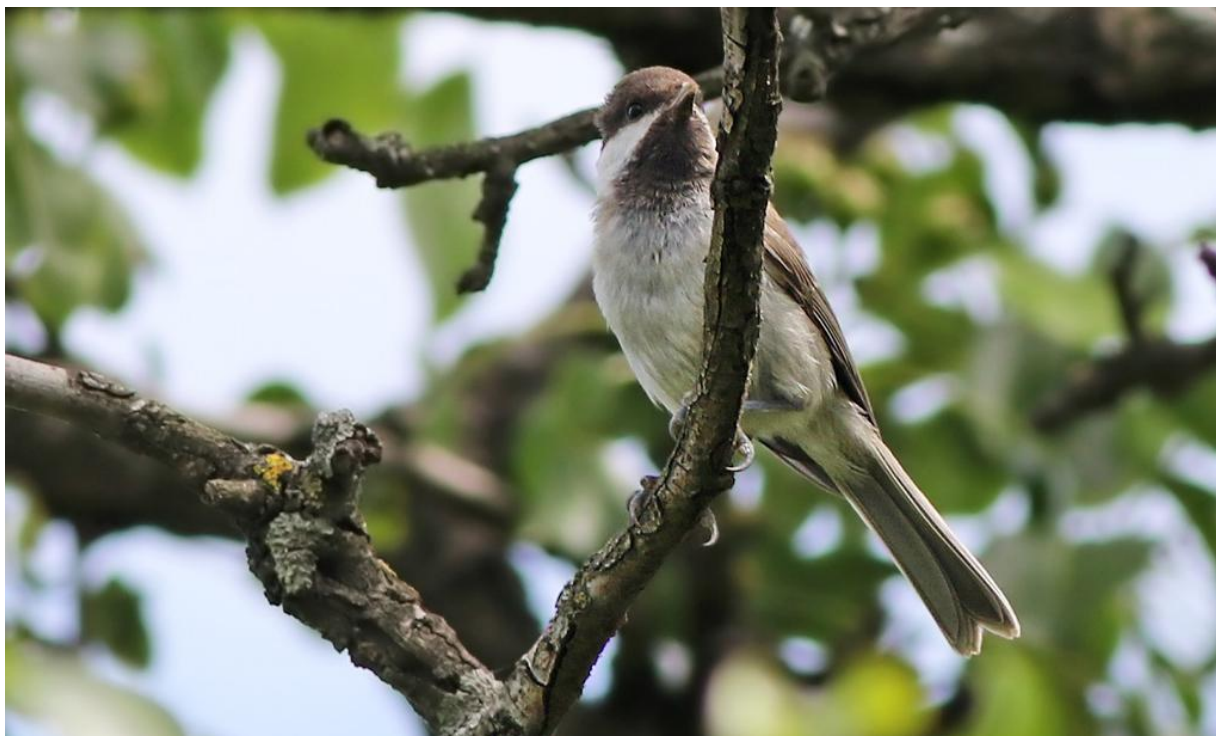
Balkanmes, Somova forest, 170528