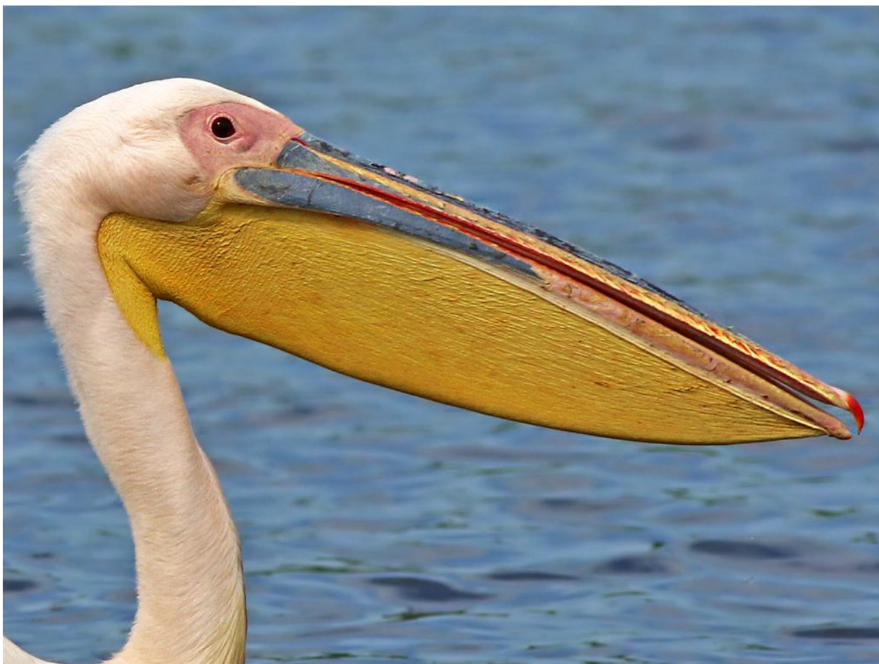
Vit pelikan, Donaudeltat, 170601.