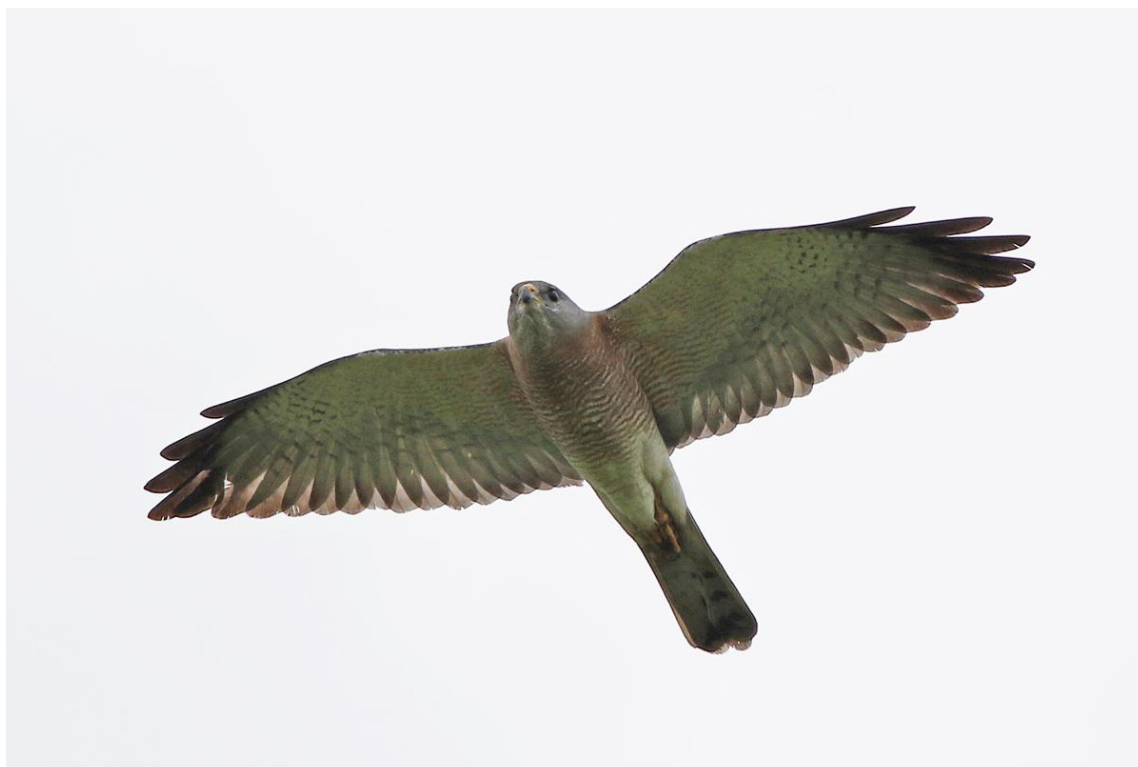
Balkanhök, ad hane, Somova forest, 170528

3 hanar och 1 hona i Somova forest 28/5 blev de enda på resan.