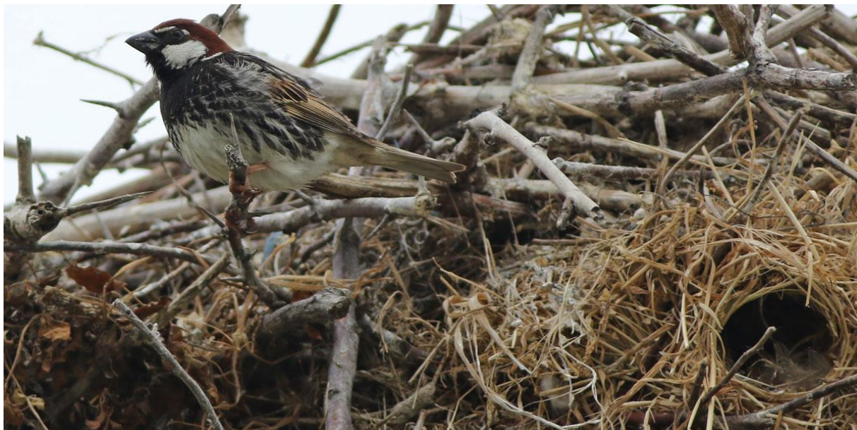
Spansk sparv vid sitt bo, i ett storkbo, 170527, Sarinasuf

157. Spansk sparv ( Passer hispaniolensis ) Sedd alla dagar utom på flodturen med enstaka ex. Sammanlagt är 21 ex noterade. Arten sågs på några ställen häcka i storkbon och arten är säkerligen ganska allmän på landsbygden i Dobrogea.