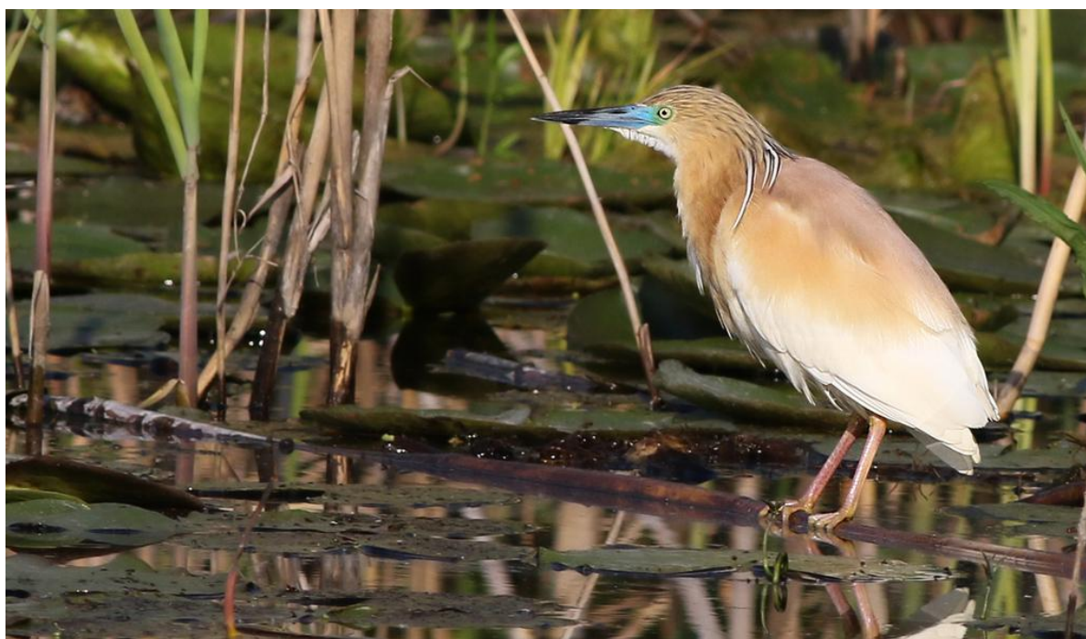
Rallhäger, Donaudeltat, 170531

Men vi kom iväg till sist och förhoppningsvis fick alla med sig vackra minnen från Dobrogea och Danube....det fick i alla fall jag!