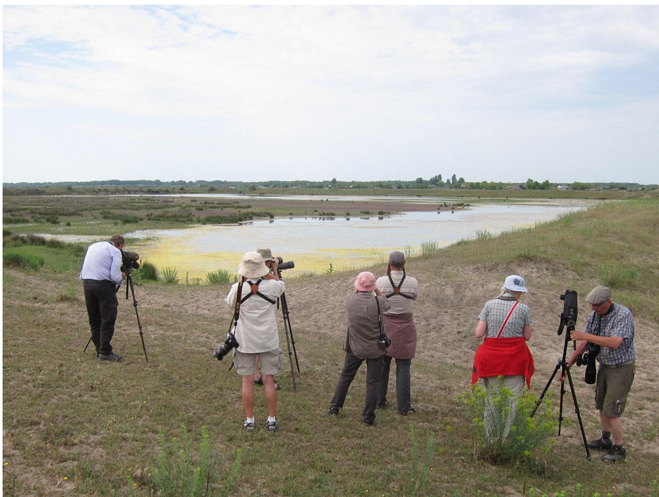
Span över salinerna vid Caraorman .

Dag 2 på floden inleddes med god frukost på hotellbåten och därefter åkte vi till "spökstaden" Caraorman med vår turbåt. Här blev det en landstigning för att spana av några saliner där vi bland annat såg skedstorkar, bronsibisar, rödspov, brushane, skogssnäppa ett gäng småsnäppor samt en 2k svarthuvad mås (tydligen ovanlig här!). Flera biätare häckade i sandbrinkarna runt ruinbyggnaderna som fanns kvar efter kommunisttiden. Vi fortsatte sedan längs ytterligare biflöden med vår turbåt och vitögda dykänder som är en rödlistad art verkade finnas i princip överallt. Pungmes var likaså mycket vanlig i området och vi såg flera bon. Vid en annan landstigning där det fanns ett fågeltorn hördes en spelande mindre sumphöna och efter att ha spelat mot den så kom den fram några gånger till allas glädje. Vi åkte även ut på en större sjö där det fanns flytande öar, riktigt coolt!