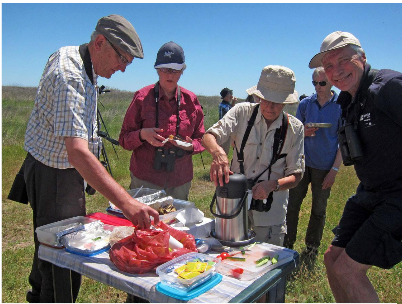
Fältlunch i Istria.

Frukost på hotellet som vanligt kl. 07.30 och bussen äntades kl. 08.30. Denna dag var det en liten programändring eftersom en amurfalk ställt till det lite. Således började vi med att köra till aftonfalkskolonin utanför Plopul och det tog inte lång stund innan vi lyckades hitta den. Den låg då ganska högt rakt över oss, kretsandes tillsammans med ett stort antal aftonfalkar. Den följande timmen fick vi riktiga njutobsar av denna läckra falk då den besökte bo där det låg en aftonfalkshona samt även uppvaktning av honan med insekt i näbben. Idag hade vi som mest c:a 120 aftonfalkar som räknades in i luften samtidigt! Väl klara här så sattes kursen mot Babadag forest , c:a 35 km söder om Tulcea. I denna frodiga i huvudsak ekskog fick vi snabbt in typiska arter såsom sjungande mindre flugsnappare, härmsångare, grönsångare, svarthätta, stenknäck samt en mellanspett. Efter detta ganska korta stopp satte vi av mot Istria . När vi närmades oss fick vi se våra första rödvingade vadarsvalor och en ormörn. Alldeles söder om Lacul Histria intog vi vår fältlunch som dukades upp vid bussen. Samtidigt njöt vi av gulärta av rasen feldegg som häckade vid vår lunchplats. Efter lunch gick vi knappt hundra meter och Daniel hittade då målarten för detta område; fältsångare. Vi fick fina obsar på en sjungande hane som visade sig fint. I området hade vi även flera sjungande trastsångare och rörsångare samt några förbiflygande rödvingade vadarsvalor.