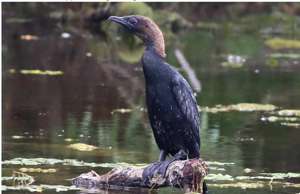
Dvärgskarv, Donaudentat, 170531

1 ex 28/5 Somova blev den enda innan vår flodtur på Donau. Arten var vanlig i deltat och sågs lite här och var. Uppskattningvis sågs 120 ex 30/5, 80 ex 31/5 och minst 150 ex 1/6.