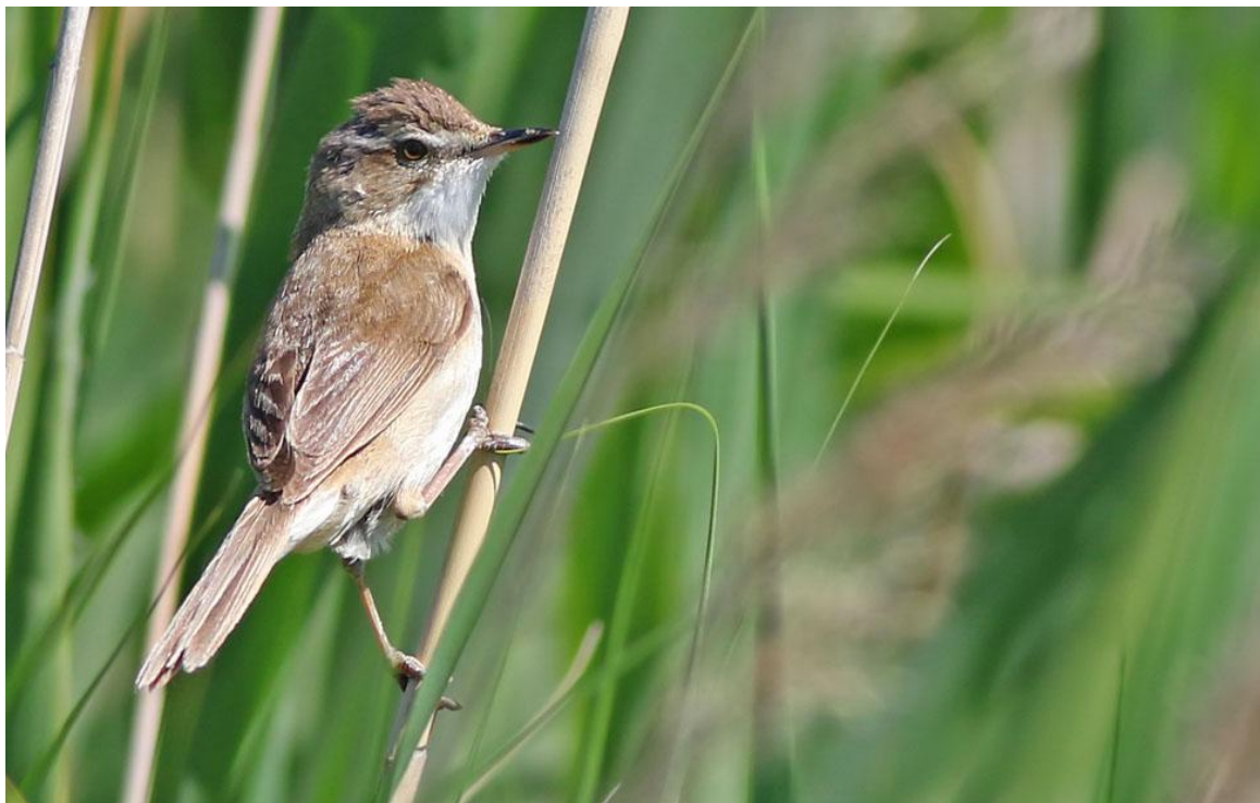
Fältsångare, Istria, 170525.