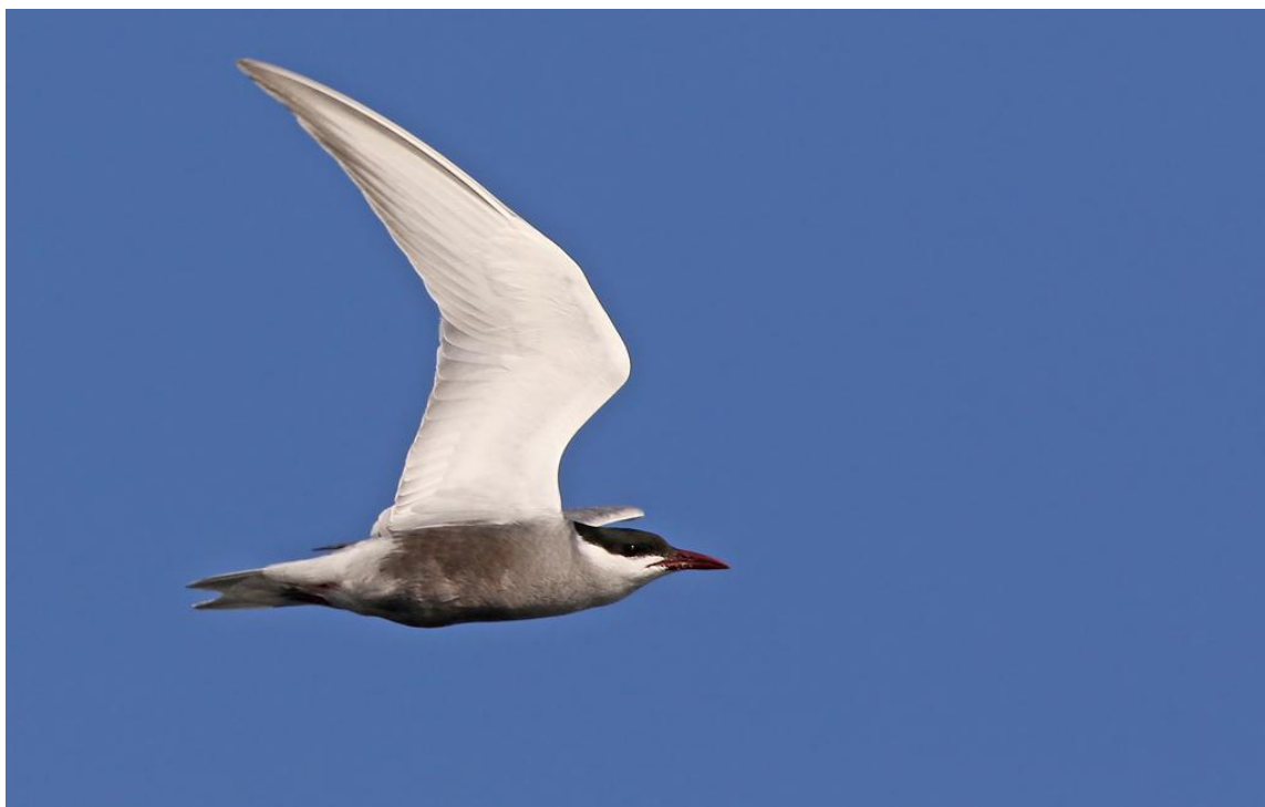
Skäggtärna, Donaudeltat, 170601

Sedd 27/5-29/5 med enstaka individer och det var först när vi begav oss ut på Donaufloten som arten blev riktigt vanlig. Alla tre dagar här gav ett par hundra individer per dag med högstanoteringen 1/6 då minst 350 ex sågs jaga insekter över träden längs sista biten på Tulcea branch innan vi nådde hamnen. Enligt Daniel så var de sent skridna till häckningen i år, vilken normalt påbörjas i första majhalvan och flera "häcksjöar" vi besökte i deltat saknade helt skäggtärnor. Vi noterade inga tärnor överhuvudtaget på bon.