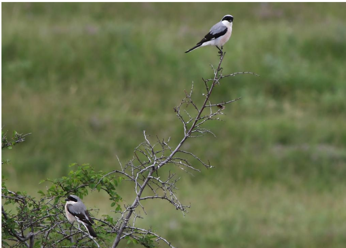
Svartpannad törnskata, 1 par, Enisala, 170527

Sedd alla dagar utom 31/5. Den törnskata vi såg på flest ställen men oftast bara ett par per lokal och inga höga koncentrationer som törnskata. Möjligen har svartpannad större revir och därav ser man bara 1-2 ex åt gången?