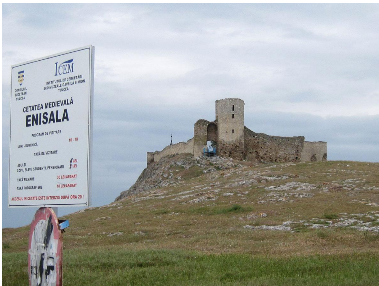
Den medeltida fästningen Enisala.

Väl på hotellet blev det tid på rummen, middag i restaurangen och artgenomgång.