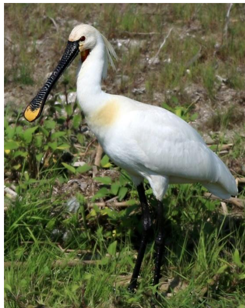
Skedstork, Donaudeletat, 170531

1 hona Donaudeletat 30/5, 2 hörda Donaudeletat 31/5 och 4 ex (3 sedda, 1 hörd) Donaudeletat 1/6.