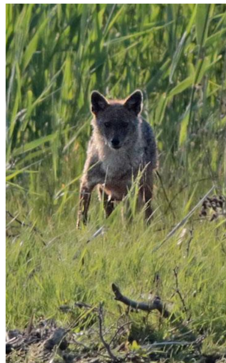
Guldschakal, Donaudentat 170530.