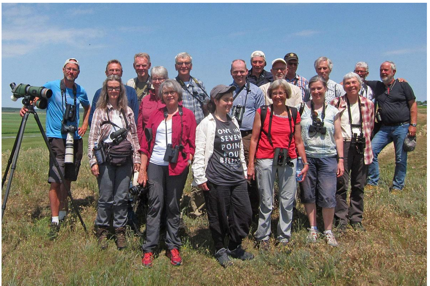
Gruppen, Urziceni, 170602