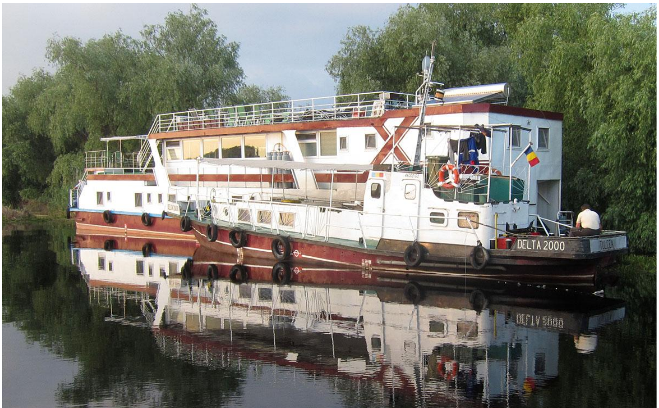
Vårt flytande hotell samt vår turbåt Delta 2000.