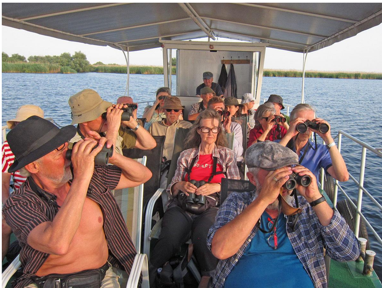
En stor del av skådningen på Donaudeltat bedrevs på detta sätt.