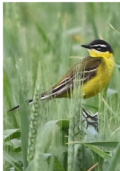
Gulärta av rasen superciliaris , Plopol, 170527.

162. Bofink ( Fringilla coelebs ) Enstaka sedda i skogsmiljöer och på Donaudeltat. Sedd alla dagar utom 26/5 och 2/6.