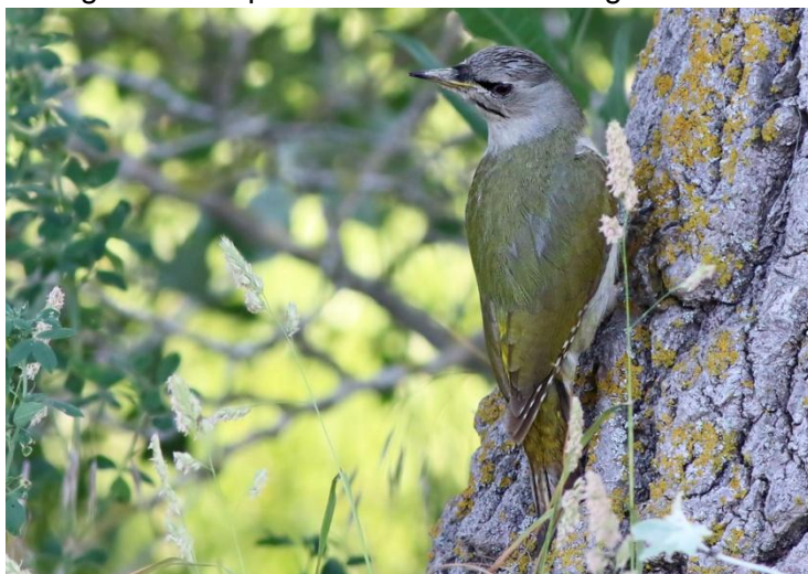
Gråspett, hona, Donaudentat, 170531

Tämligen allmän på Donaudentat och vi såg/hörde 7 ex 30/5, 6 ex 31/5 och 6 ex 1/6.