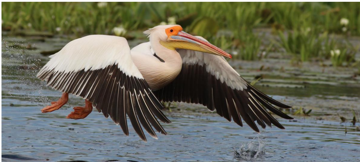
Vit pelikan, Donaudentat, 170601

Sedd samtliga dagar utom 26/5. Alla dagar 27/5-1/6 noterades över 300 individer med toppnoteringar 28/5 med 775 ex och 1/6 med 700 ex. Största flock som noterades var vid Somova forest på närmre 500 individer!