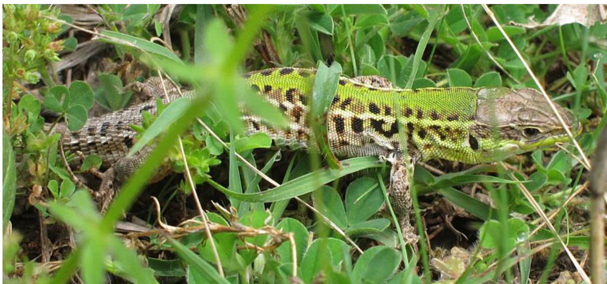
Taurisk murödla, Somova forest, 170528.

1 ex över vägen när vi lämnade Plopol 29/5 och 1 ex över vägen mellan Vadu och Playa Vadu 29/5.