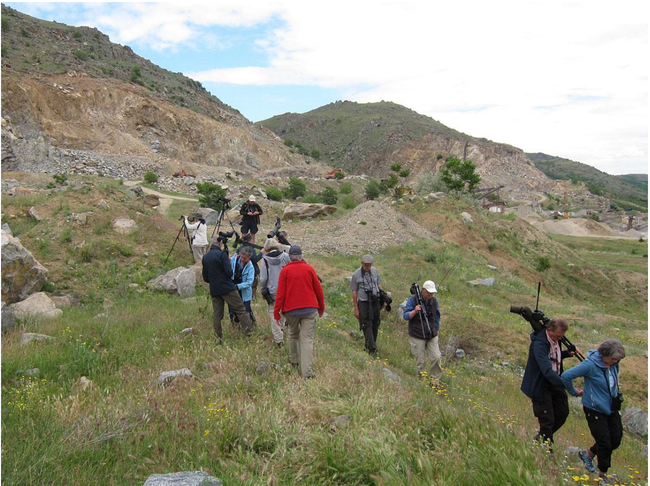
Det blev lite klättring i branten till Macin mountains men vi belönades med stentrast.

Efter lunchen körde bussen oss till Macin mountains som utgjorde den västligaste posten på vår resa. Här fick vi se en del rovfåglar såsom örnvråk, stäppvråk, ormörn och mindre skrikörn. Vid foten till berget fick vi även till sist en hane stentrast som häckar här. Den tubades in då den satt högst upp på berget. Andra arter var bland annat svart rödstjärt, nunnestenskvätta samt spelande vaktel. Nästa stopp var stäppen utanför Greci . Detta område skall enligt vår lokala guide hysa Europas största bestånd av isabellastenskvätta, vilket märktes av direkt, över 200 individer räknades in! Här var även väldigt gott om sislar, uppskattningsvis över 500 (!) och vi fick många närobsar av denna trevliga gnagare. Örnvråk fick vi se på bo med tre ungar i och dessutom en örnvråk som nästan slog en stäppiller. Korttålarcka och sånglärka sjöng och vid skogsbrynet hördes trädlärka. Mellanspett sågs fint vid en fårfarm och här var också gott om turturduvor. En rödhuvad törnskata sågs på håll i toppen av ett buskage och en av deltagarna fick se en tjockfot flyga förbi; en art som häckar här med några par men som blivit svårare på senare år. Efter detta körde vi till hotellet där vi som vanligt tog en stund på våra rum innan middag och artgenomgång.