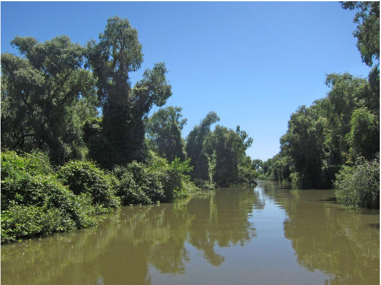
An der schönen blauen Donau.

Efter lunch tog oss hotellbåten längre in i deltat och då blev det en runda i mindre biflöden med vår turboat där en guldschakal längs stranden under kvällningen blev den häftigaste upplevelsen. Därefter en god trerättersmiddag och artgenomgång på vårt flytande hotell.