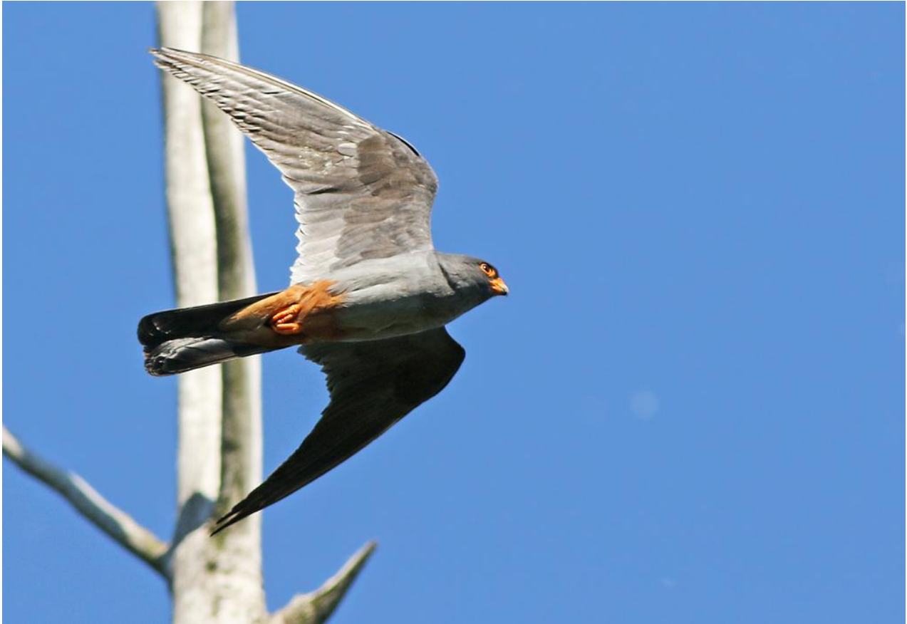
Aftonfalk, adult hane, Plopul, 170529