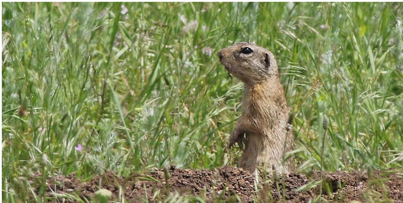
En av många sislar i Greci 28/5.