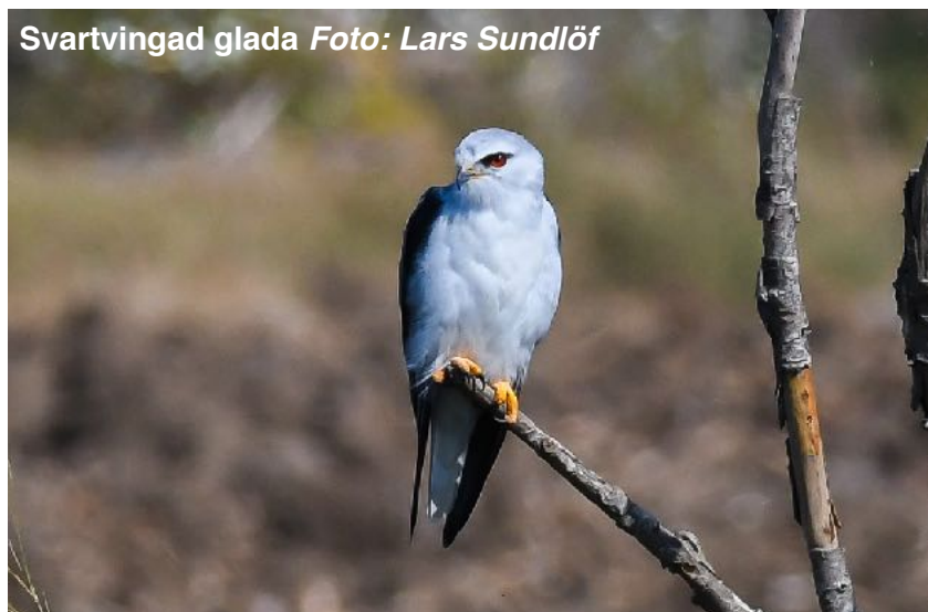
Svartvingad glada