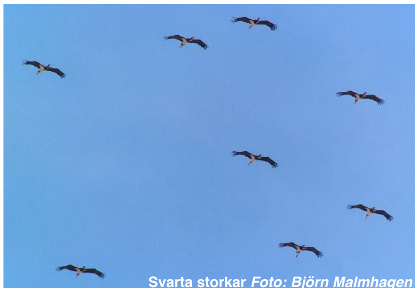
Svarta storkar