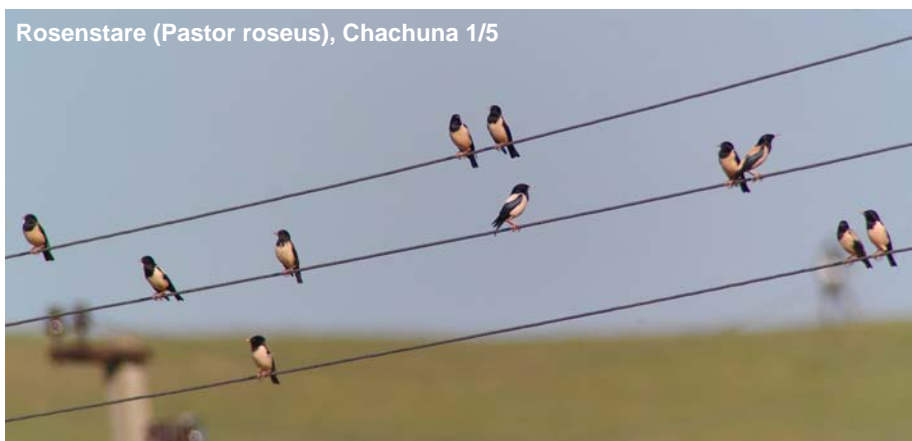
Rosenstare ( Pastor roseus ), Chachuna 1/5

Tämligen allmän i området kring Stepantsminda 27-30/4.