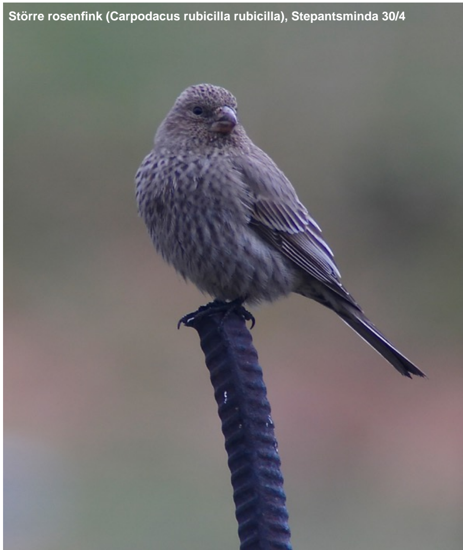
Större rosenfink ( Carpodacus rubicilla rubicilla ), Stepantsminda 30/4