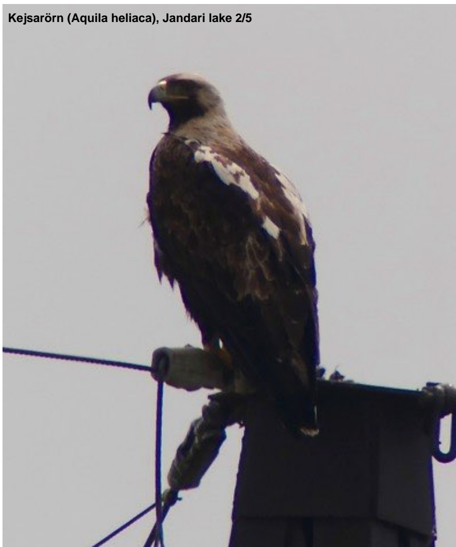
Kejsarörn ( Aquila heliaca ), Jandari lake 2/5