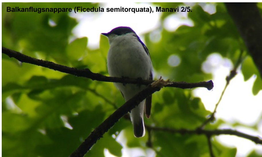
Balkanflugsnappare ( Ficedula semitorquata ), Manavi 2/5.

1 par bokskogen S om Ananuri 30/4 och 1 hane Manavi 2/5.