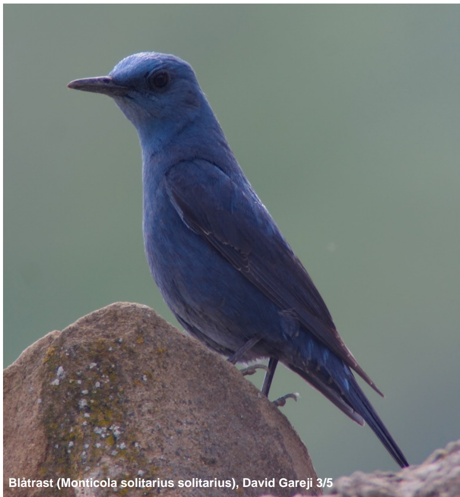
Blåtrast ( Monticola solitarius solitarius ), David Gareji 3/5

Tämligen allmän och noterad samtliga dagar.