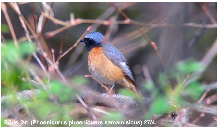
Rödstjärt ( Phoenicurus phoenicurus samamisticus ) 27/4.

Tämligen allmän i området kring Stepantsminda 27-30/4 samt längs vägen till och från Stepantsminda. Även 1 hane David Gareji 3/5.