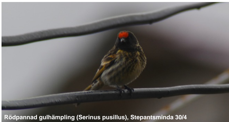
Rödpannad gulhämppling ( Serinus pusillus ), Stepantsminda 30/4