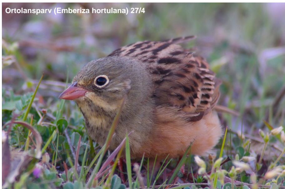
Ortolansparv ( Emberiza hortulana ) 27/4

1 ex längs vägen till Stepantsminda 27/4.