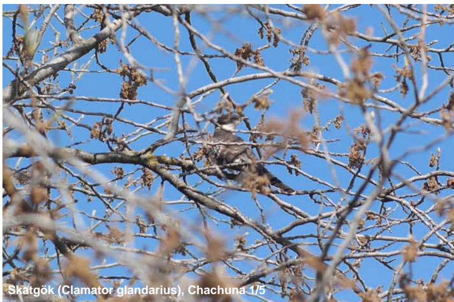
Skatgök ( Clamator glandarius ), Chachuna 1/5