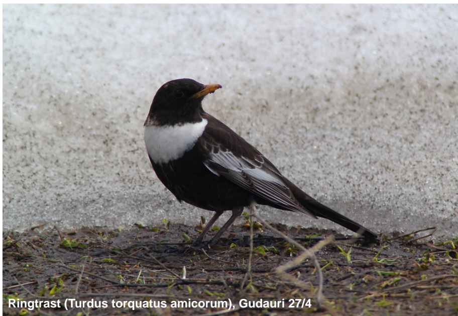
Ringtrast ( Turdus torquatus amicornum ), Gudauri 27/4

Allmän och noterade dagligen i låglandet 30/4-3/5. Intressant var att notera hur överlag mörka dessa fåglar var. Somliga var i det närmaste helt svarta utan ljusare fläckar. Vidare var det också intressant att notera deras sång som också till viss del påminde om svartstare med höga visslingar.