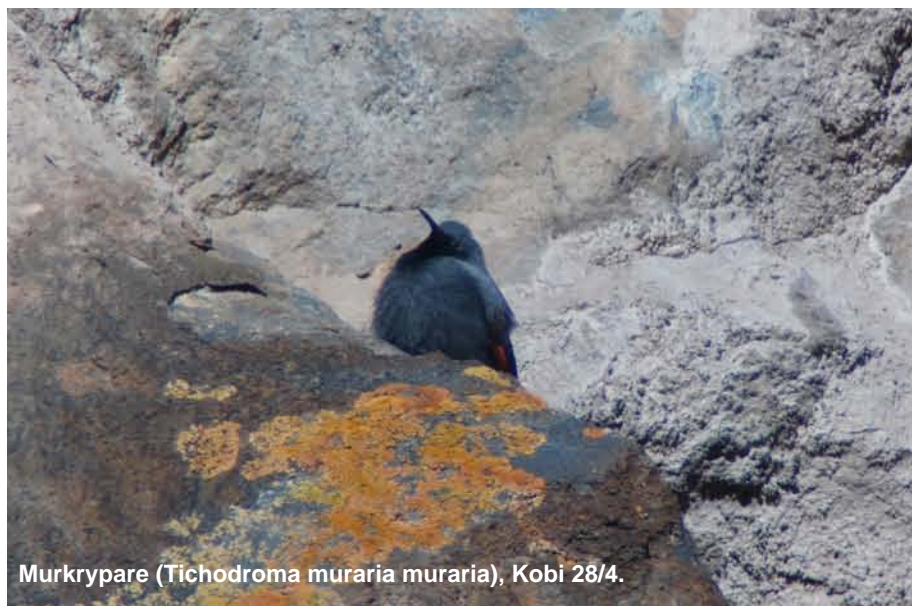
Murkrypare ( Tichodroma muraria muraria ), Kobi 28/4.