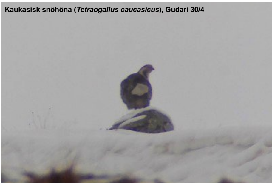
Kaukasisk snöhöna ( Tetraogallus caucasicus ), Gudari 30/4