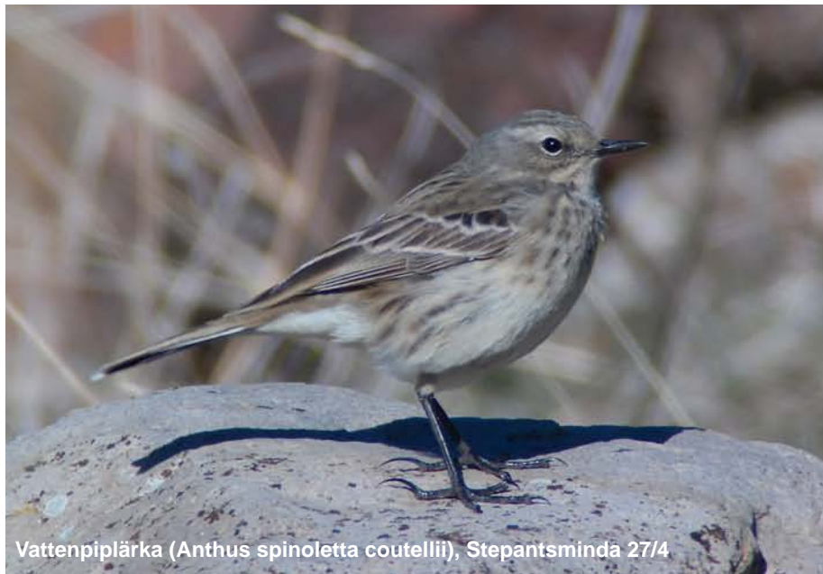
Vattenpiplärka ( Anthus spinoletta coutellii ), Stepantsminda 27/4

5 ex längs vägen till Stepantsminda 27/4, 15 ex Chachuna 1/5 och 10 ex längs vägen till David Gareji 3/5.