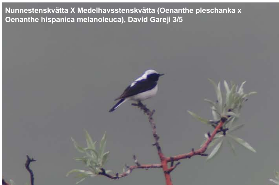
Nunnestenskvätta X Medelhavsstenskvätta ( Oenanthe pleschanka x Oenanthe hispanica melanoleuca ), David Gareji 3/5