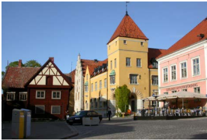
Torvet i Visby