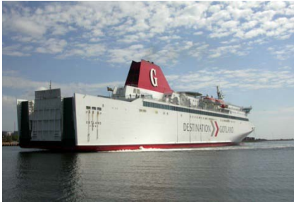
Færgen til Gotland

Pension: Ingen måltider er inkluderet denne dag