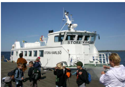
Båden til St. Karlsö

Pension: Morgenmad, frokost og aftensmad er inkluderet denne dag