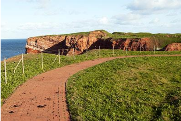
Stien ud til fuglefjeldet