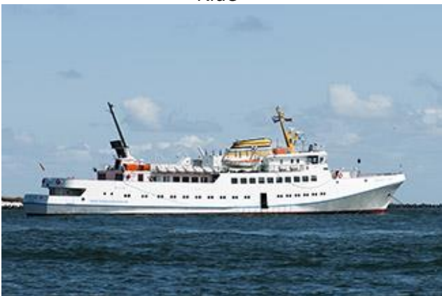
Båden til Helgoland