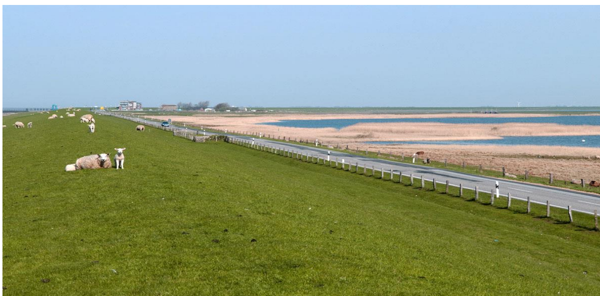
Schlüttsiel og Hauke-Haien Koog

Midt i området passerer vi selve Schlüttsiel-slusen med den lille havn. Den 26 meter brede sluse har fire porte og lukker automatisk, alt efter flod og ebbe. Herefter kører vi tilbage til København med et stop på Fyn.