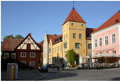
Torvet i Visby