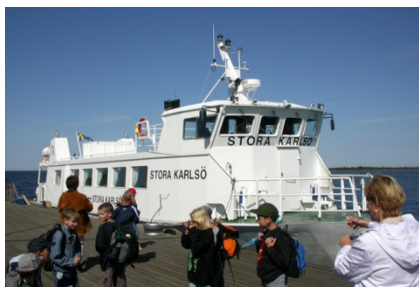
Båden til St. Karlsö

Pension: Morgenmad, frokost og aftensmad er inkluderet denne dag