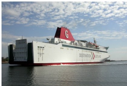
Færgen til Gotland

Pension: Ingen måltider er inkluderet denne dag